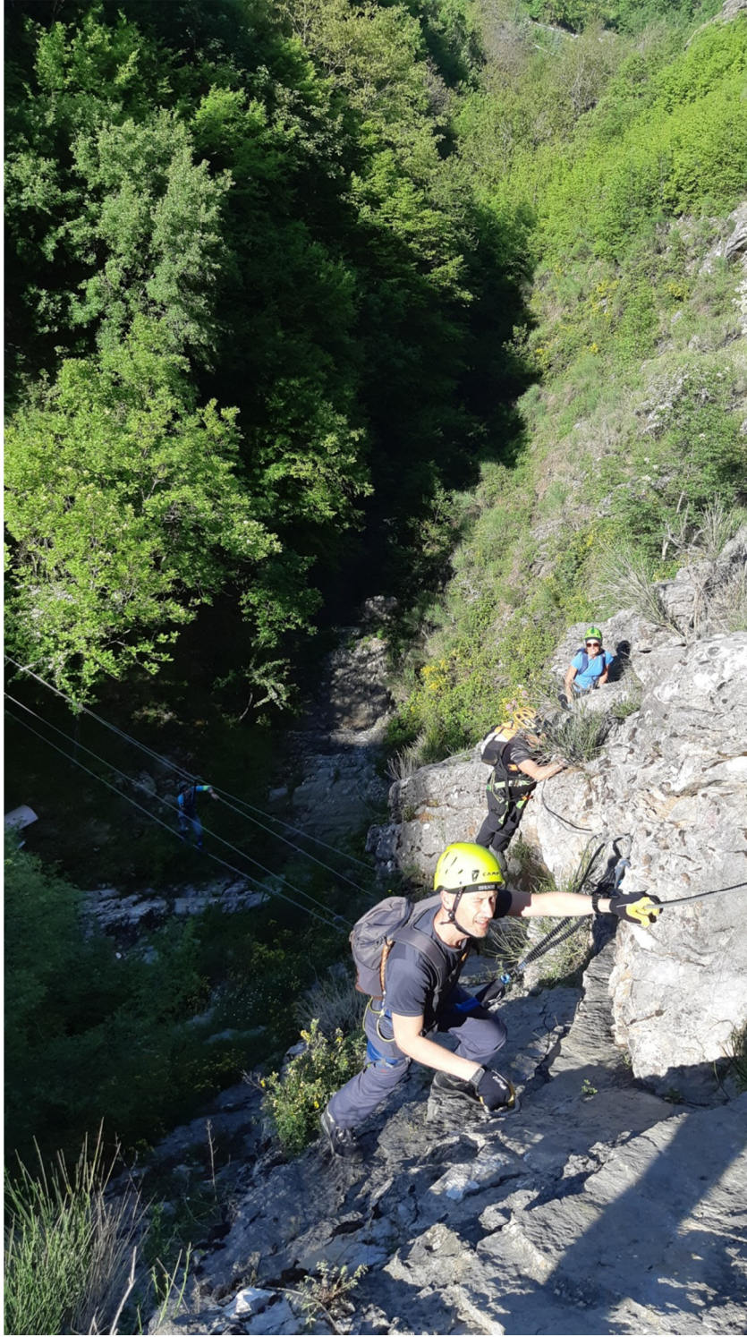
Via Ferrata “Arenazzo”

La via ferrata è un percorso attrezzato con cavi metallici, staffe, scalette e ancoraggi fissi che facilitano l'accesso alla vetta o a qualsiasi altra meta.